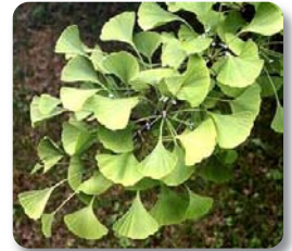
El Ginkgo biloba combate la pérdida de memoria

Más que de curar enfermedades, se trata de generar salud. Con la ayuda del paciente y la aplicación de las terapias adecuadas para cada caso buscaremos la curación total del enfermo.