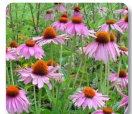
La Echinacea previene y trata los síntomas gripales