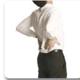
La homeopatía aborda el tratamiento de enfermedades agudas y crónicas

La Homeopatía (curar por lo igual) consiste en dar a nuestro cuerpo lo mismo que nos hace enfermar, pero en dosis infinitesimales, con lo que conseguimos la curación de nuestro organismo sin efectos secundarios ni contraindicaciones.