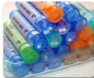
Tubos de gránulos homeopáticos

Su aplicación es habitual y efectiva en otras ramas de la Ciencia, como la veterinaria.