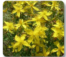
El Hiperico o hierba de San Juan está indicado para el tratamiento de la depresión