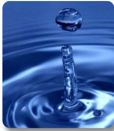
Beber más agua

Muchas enfermedades son producidas o desencadenadas por una mala alimentación: enfermedades autoinmunes, hipertensión, diabetes mellitus, dermatitis o rinitis alérgicas, depresión, etc.