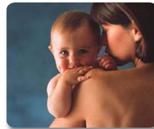
Embarazadas y bebés se benefician de la homeopatía

crónicas que hasta ese momento recibían un tratamiento meramente paliativo, en vez de curativo (fibromialgia, artrosis, depresión, obesidad, etc.), además de proporcionar tratamientos menos agresivos para enfermedades comunes.